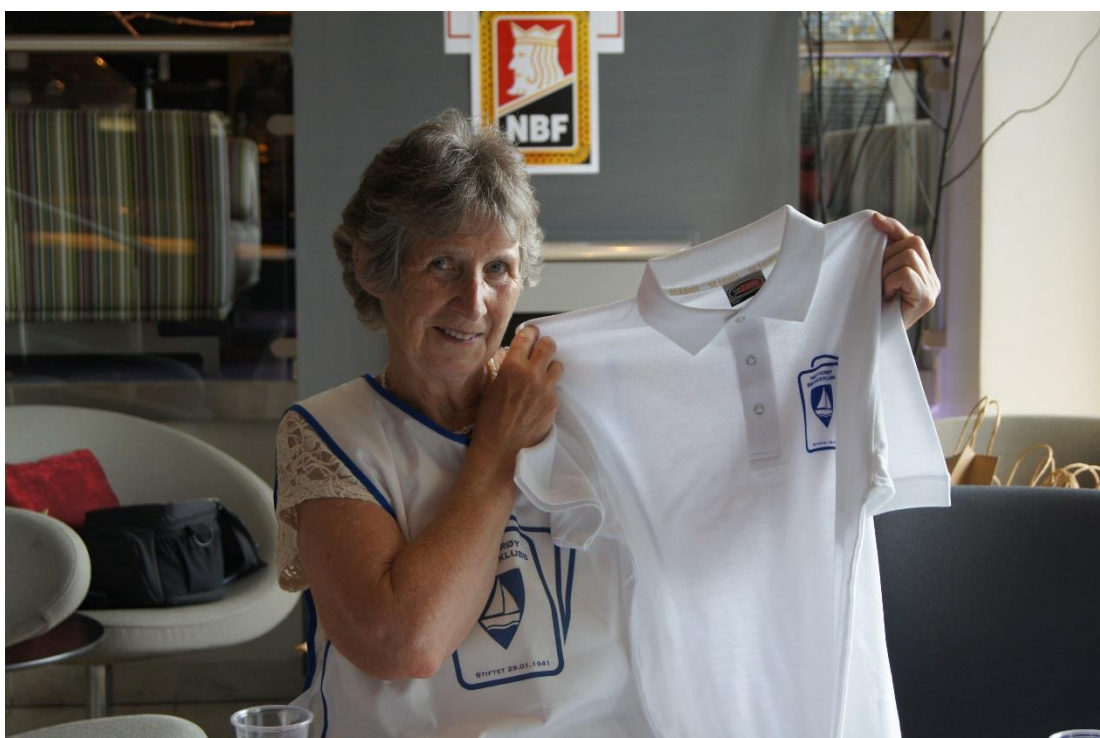
Husk at du kan kjøpe med en suvenir hjem!