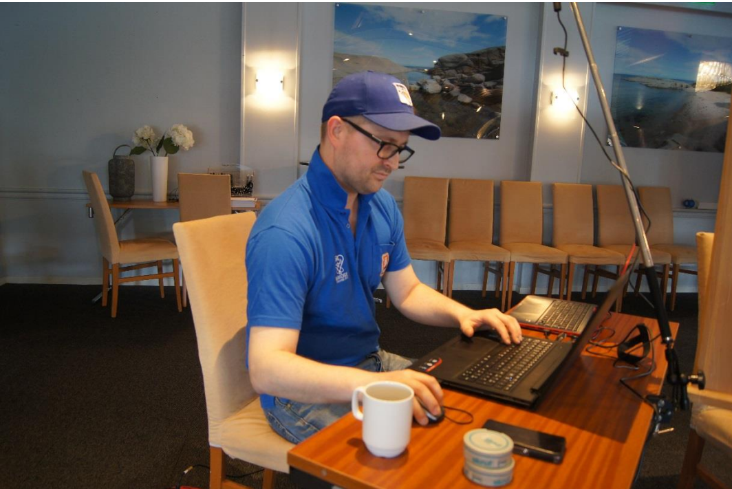
Full konsentrasjon, overføringen på BBO må være riktig !