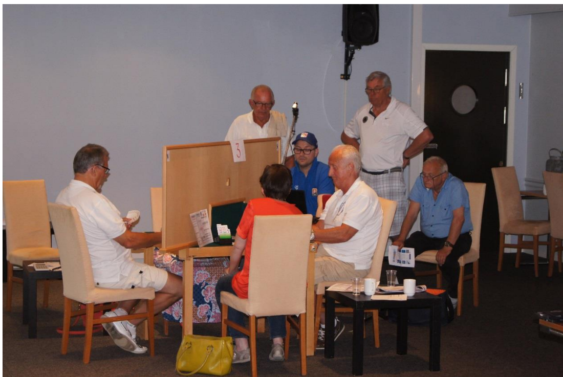
Stor interesse for hjemmelagets spillere.