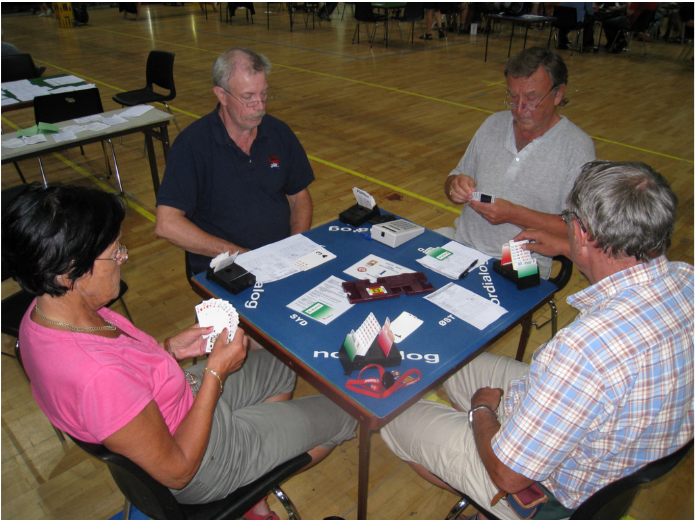
Spillere i dyp konsentrasjon under NM Veteran lag