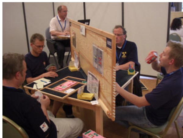
Svenskene holdt ikke koken til å nå Bermuda Bowl etter å ha vunnet innledende runder overlegent og slått Norge klart. Hvorfor ble Norge bedre da det virkelig gjaldt og slo svenskene i finalerunden?

Idrettsfolk snakker om å komme "i sonen". Det er en psykologisk kategori der du ikke spør deg selv hva du skal gjøre. Du bare gjør alt på den måten som er riktig. Som tennisspiller server du like godt som i drømme. Som skihopper bare vet du akkurat hvor hoppkanten er, og treffer den perfekt i satsen nesten uten anstrengelse. Som bridge-spiller "ser" du alle de små bevisene på hvordan kortene sitter og bare "vet" hva du skal gjøre - nærmest uten å tenke.