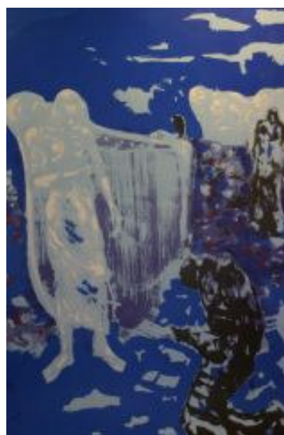
Snøharpan av Håkon Bleken

Premieseremonier finner sted i hallen hver dag (unntatt mandag) klokken 1530.