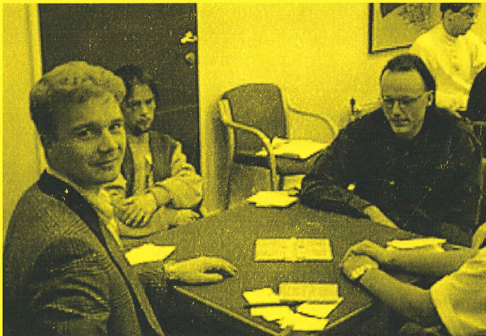
Lederparet etter første dag, Kvangraven - Nygjelten