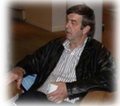
Pappa Græsli overvåker junioravdelingen på tur.