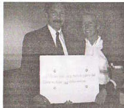
Overrekkelsen av Paulusprisen

Dette vandretroféet bør henge høyt, også hjemme på veggen i stua, vakkert brodert som det er, med korssting i gull på hvit linduk, og med følgende Pauli ord til formaning og ettertanke: "FOR VILJEN HAR JEG, MEN Å GJØRE DET GODE MAKTER JEG IKKE". (Rom. 7, 18)