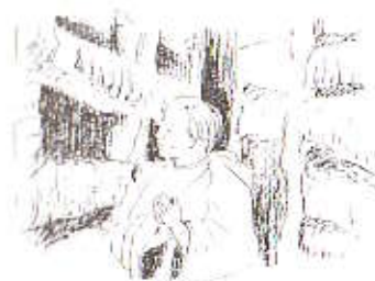
Strøm i katakombene

Han ser seg derfor nødsaget til å fratrede sin plass i panelet.