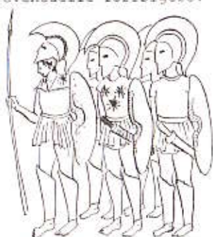
Den bolde BIN-redaktør

Den sagnomsuste Oslo-redaktør forventes å møte til gallaforestillingen i ridderrustning, nøye bevoktet av fire staute hoplitter som kan ta seg av eventuelle forfølgere.