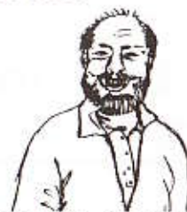
Kåsøren får igjen slippen.

Hadde Vest valgt å kaste en kløverhonnør, ville han ha godspilt kløveren og kastet 2 hjertere på ruter, og hadde han kastet en hjerter, ville han ha toppet ut den ene honnøren. Kåsøren hadde vært meget fornøyd med sine ferdigheter etter dette spillet, og på slippen hadde han også fått lønn for strevet.