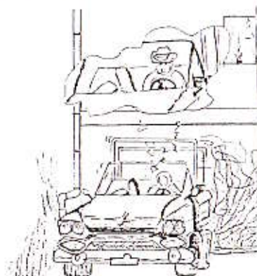
Filosofen før vekking

Til slutt pirret nysgjerrigheten dem såpass at de toget ut for å bivåne det som utspant seg utenfor. Der observerte man Filosofen sittende i bilen med motoren i gang. Ved nærmere ettersyn viste det seg at han sov. Vekking ble prompte foretatt, og ut av drømmeland ble han brutalt revet.