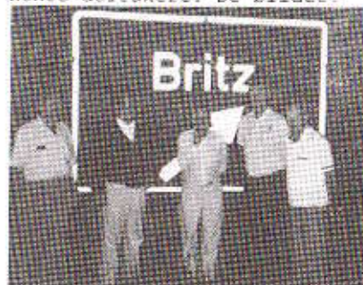
Et utvalgt knippe...

Kl 17.00 søndag var alt klart for avgang, og vi grudde litt for den anstrengende kjøreturen. Imidlertid gikk det strykende, og vi fikk nesten ikke sukk for oss før vi mandag morgen var klar til å innta en solid hotellfrokost i Flensburg. Da hadde vi til og med tatt oss tid til å stoppe ved avkjøringen til BRITZ som ligger i Øst-Tyskland ca 5 mil fra den polske grensen. Her benyttet vi sjansen til å forevige et knippe av våre mest prominente deltakere. Se bildet!