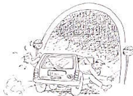
Fakiren ved tunnellingangen.

ga Fakiren god gass og satte snuten i retning mot tunnelen. Høylydte utbrudd fra baksetet fikk ham imidlertid til å lure på om alt var som det burde være, og da han rett foran bilen sin fikk en stortutende, motgående bilist inn i synsfeltet, styrte han hardt til høyre og klarte å stoppe rett foran inngangen.