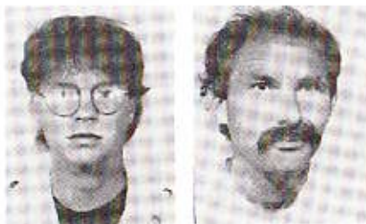
BRO's utsendte medarbeidere vant (som ventet?)