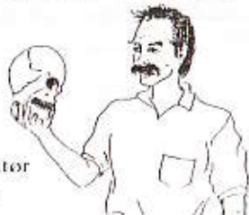
BRO's redaktør som Hamlet

Når jeg i de følgende oppgaver har valgt Shakespeares som følgesvenn og veilder, skyldes det ikke minst at han i sitt kanskje mest kjente sitat tar opp en for bridgepillere eksistensiell problemstilling: "To bid or not to bid, that's the question!" * Red) W. S. var forøvrig ikke helt på høyden her. Hamlet burde selvsagt ha formulert seg som følger: "To bid and what to bid, that's the question!"